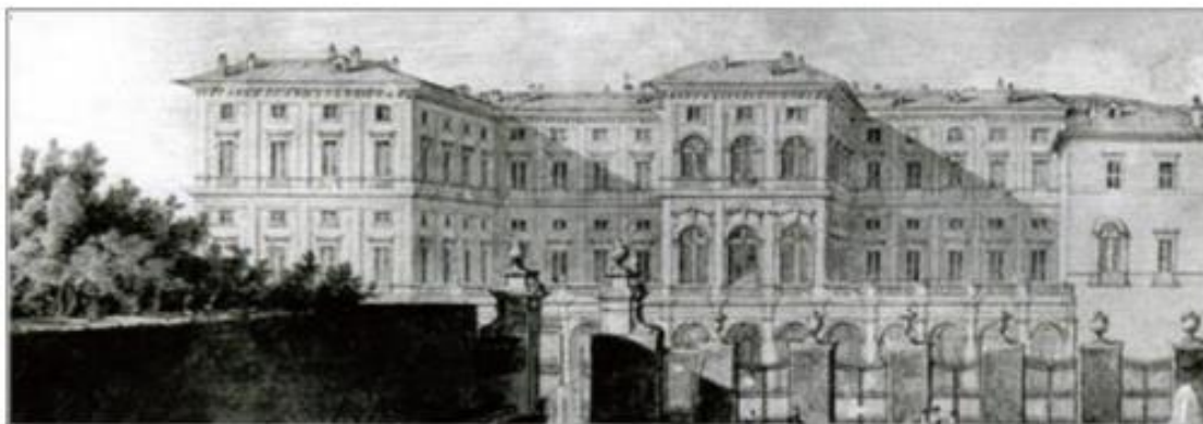
Roma - Palazzo Corsini

Curate dai Soci Lincei, le «Segnature» del mercoledì comprendono conferenze, giornate di studio o brevi convegni concepiti secondo un ampio spettro tematico, anche con la partecipazione di studiosi esterni all'Accademia. Si tratta di un'iniziativa volta a favorire la più ampia diffusione delle molteplici attività dell'Accademia. Nel loro esprimere carattere di universalità, le «Segnature» mantengono però il tratto distintivo di un apporto compiuto e ben definito nel campo delle conoscenze; per tale motivo si è pensato di intitolarle prendendo spunto dalla dicitura latina medievale signatura , che nell'antica stesura dei manoscritti spesso denotava la “firma” o “sottoscrizione” apposta dal redattore alla fine del testo trascritto. Il termine trovò presto applicazione in bibliologia ad indicare l'insieme dapprima delle lettere e in seguito dei numeri usati per marcare, nei libri a stampa, il progressivo succedersi dei fogli e dei fascicoli in modo da poter legare il volume nel giusto ordine. Nella odierna accezione lincea ciò si traduce in una sequenza di iniziative caratterizzate dalla unità, pur nella molteplicità di metodi e di temi.