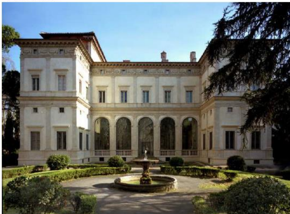
Villa Farnesina, Roma