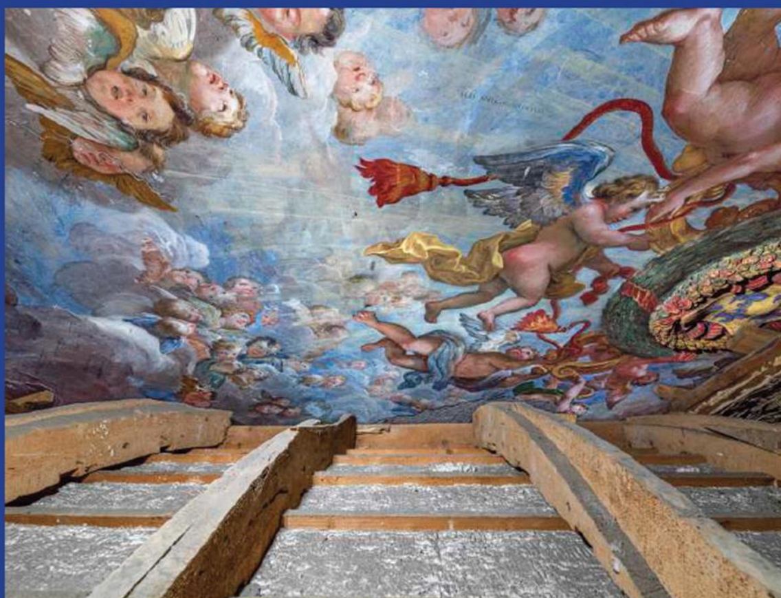
Veduta delle decorazioni seicentesche scoperte sopra la volta ottocentesca dell'antico atrio di Villa Farnesina

a cura di Alessandro Zuccari e Virginia Lapenta